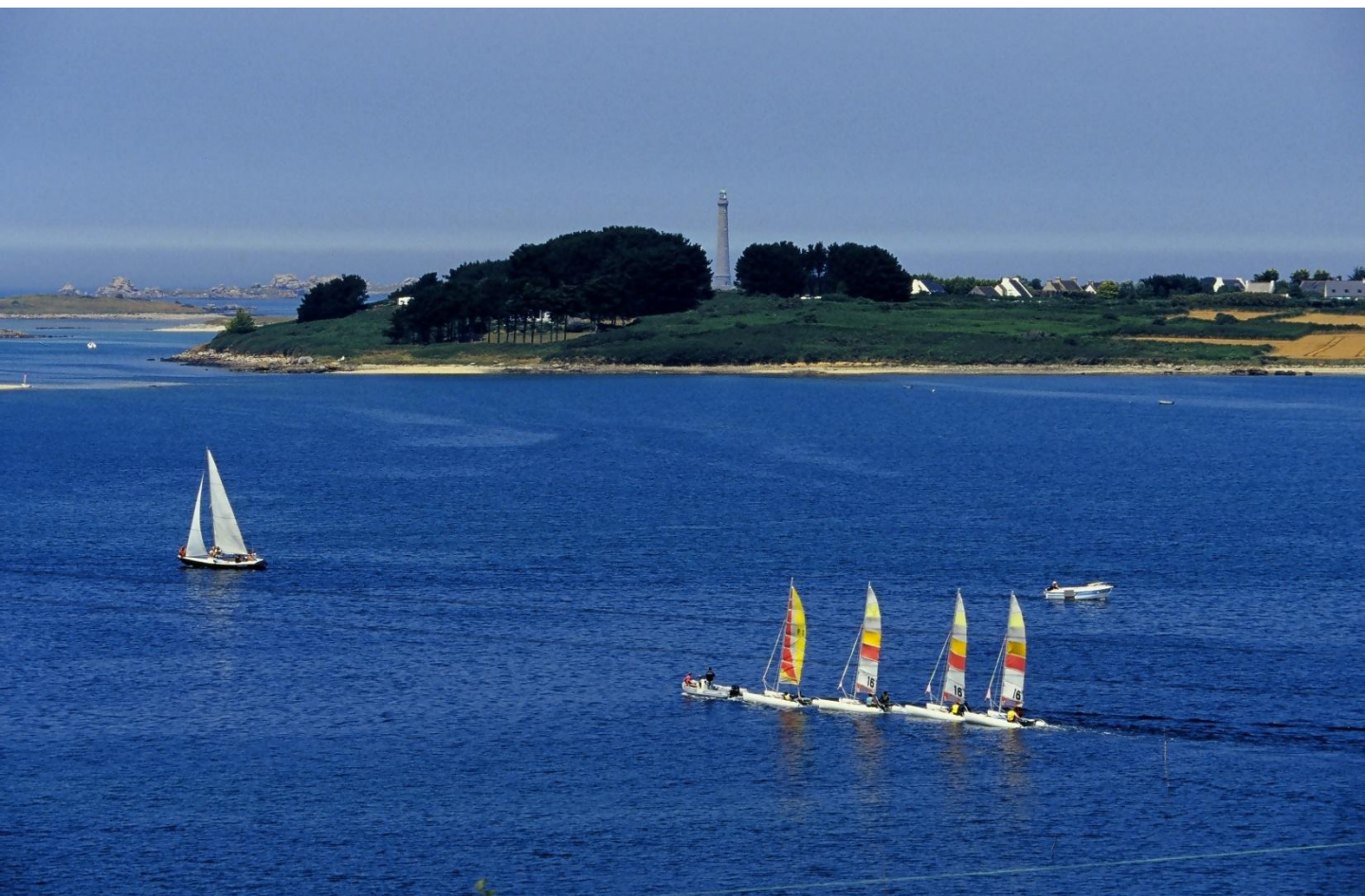
Phare de l'île Vierge, Plouguerneau

Localisé à l'extrême ouest breton , le Pays des Abers-Côte des Légendes a deux facettes, l'une rurale et l'autre maritime.