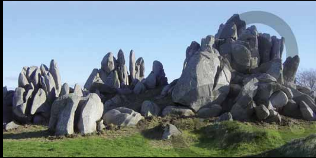
Les Barrachou, Guissény