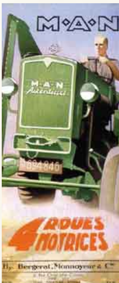
table "révolution" qui propulsa la région aux premiers rangs français, voire européens. Ce mouvement, impulsé par la Jeunesse Agricole Catholique, vit se développer les centres de formation, la mécanisation, le remembrement des terres, les syndicats, les groupements de producteurs, le marché au cadran, l'industrie agroalimentaire, les réseaux bancaires, les circuits commerciaux...

Mais, en moins de deux décennies, l'agriculture du Léon allait passer d'un stade quasi-autarctique à une toute autre échelle. Les pratiques culturelles et l'organisation du monde paysan léonard connurent une véri-